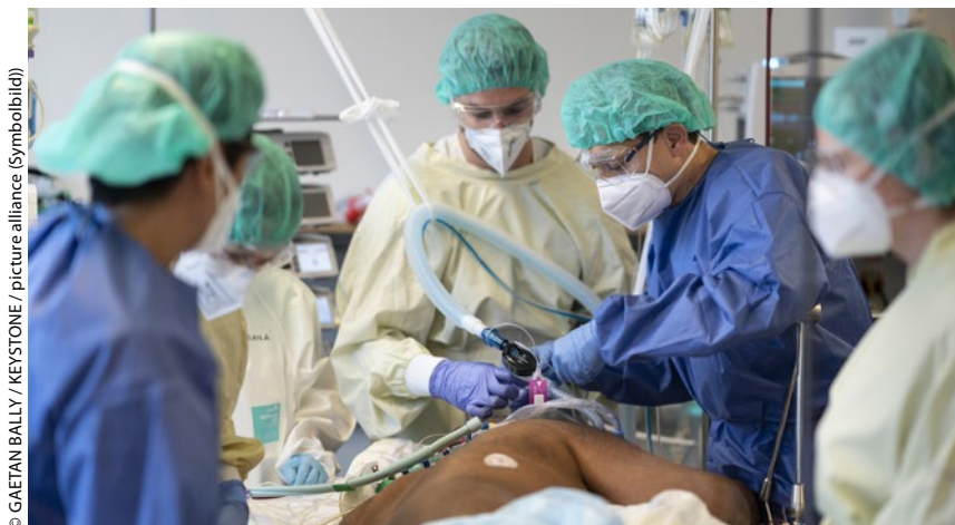
Pflegendende auf den Intensivstationen brauchen endlich die nachhaltige Unterstützung, die seit vielen Jahren überfällig ist